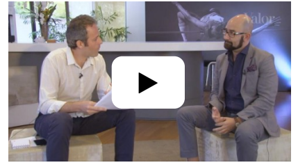
Inteligência artificial será tão essencial quanto energia elétrica 06/01/2017